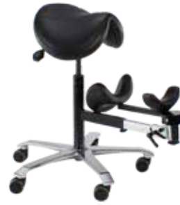
Artromove, vermindert pijn bij heupartrose